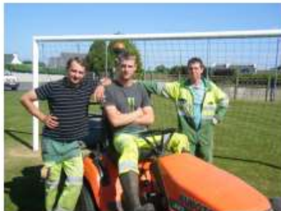
▲ Les employés communaux ont remis en état l'aire de jeux