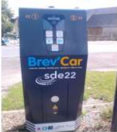
▲ La borne est en service depuis juin

Une borne de recharge pour les véhicules électriques a été installée sur la place du 19 mars au bourg de Camlez. Elle est en service, son raccordement au réseau électrique réalisé par le Syndicat Départemental d'Énergie. Chaque borne de charge a un coût hors taxe de 10 000 euros.